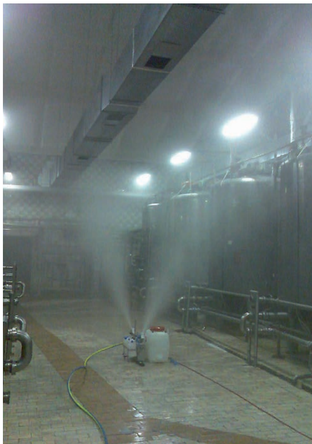
Kaltvernebelung stellt eine wirksame Präventivmaßnahme in der Lebensmittelherstellung dar und erhöht die Produktsicherheit.

In der Praxis passiert es oft, dass bei Kontrolle der Reinigungswirksamkeit Keimbelastungen auf den Oberflächen festgestellt werden, obwohl die Reinigungsmaßnahmen ordnungsgemäß durchgeführt wurden. Als Quelle dieser Kontamination stellt sich dann immer die Raumluft heraus. Eine Kaltvernebelung kann zur Lösung dieses Problems beitragen.