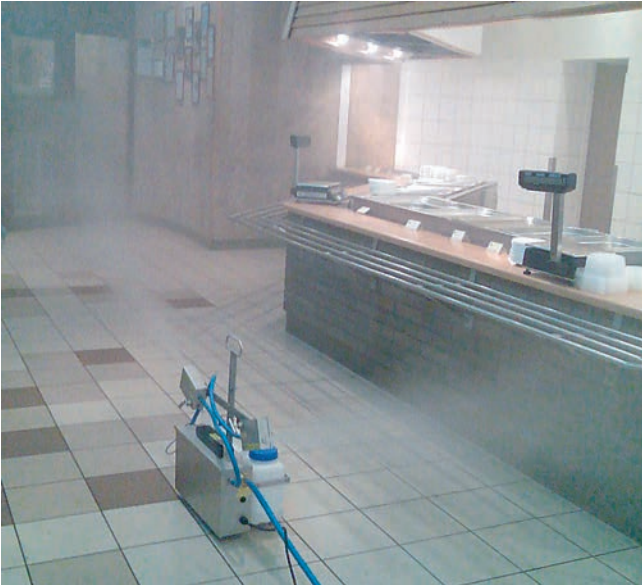
Auch in der Essensausgabe oder im Restaurant lässt sich das Verfahren problemlos außerhalb der Öffnungszeiten anwenden.

ge erhalten und wirksam, bis er abgetragen wird. Sobald Pilzsporen, Bakterien, Viren oder andere Mikroorganismen mit dem intakten Wirkstoff-Film in Berührung kommen, sterben sie ab. Damit zeigt der Wirkstoff eine nachhaltige Wirkung. Die Erfahrungen aus dem praktischen Einsatz unter verschiedenen Bedingungen in der Lebensmittelherstellung zei-