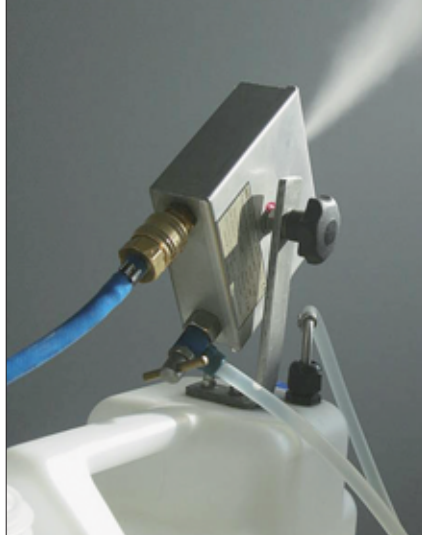
Kaltvernebelung zur Bekämpfung von Schimmelpilzen und Keimbelastungen

Eine weitere aktive Maßnahme zur Bekämpfung von Schimmelpilzen und Keimbelastungen, die ebenfalls von